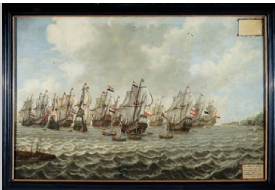
Een schilderij van een anonieme kunstenaar. Het briefje rechts onder vermeldt dat het om een retourvloot uit Indië gaat. De schepen arriveerden op 8 augustus 1648 in ons land. Hier is het vertrek van de vloot uit Batavia weergegeven.