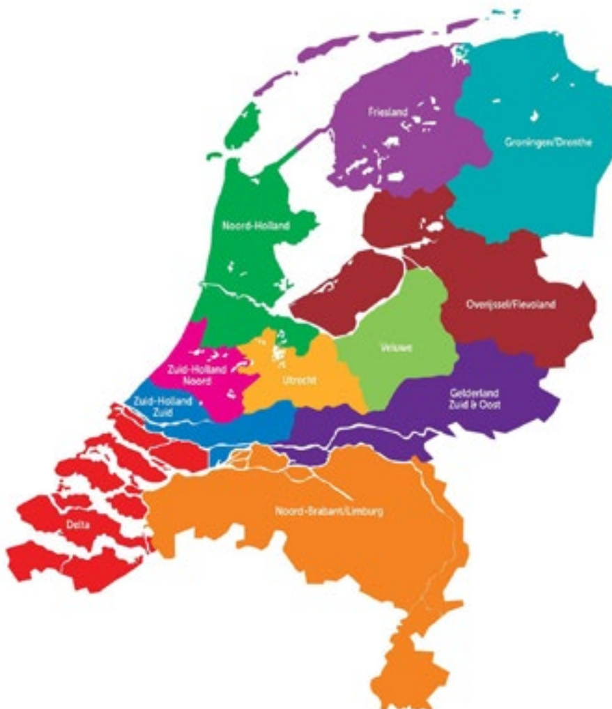
Classisindeling Protestantse Kerk in Nederland