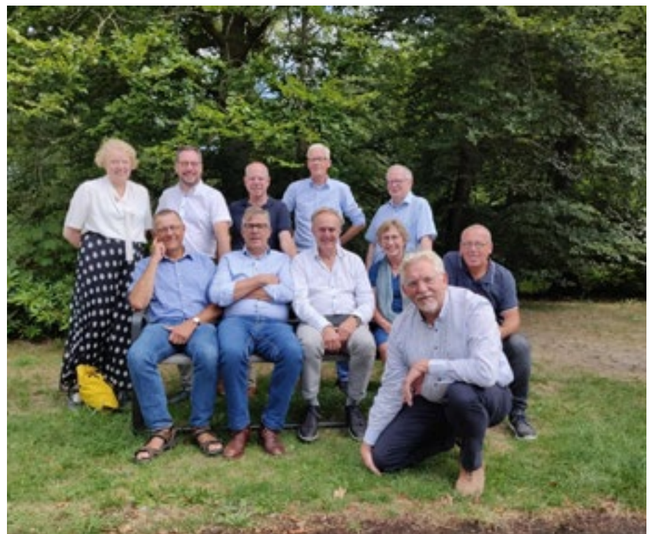
Het elftal classispredikanten.